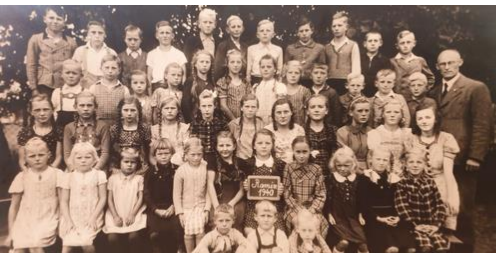
Zapisy do szkół w Ramin 1940 r. (wzięte: www.raminpommern.de , dostęp: 17.2.23).

infrastrukturalnych. Oba reżimy podniosły rangę wsi i małych miasteczek oraz prowincji i w ten sposób skutecznie wykorzystały potencjał mobilizacyjny obszarów wiejskich. Kryzysy takie jak upadek reżimu nazistowskiego w 1945 roku, masowa imigracja przesiedleńców po 1945 roku czy negatywne skutki przymusowej kolektywizacji i uprzemysłowienia produkcji roślinnej i zwierzęcej nie były w stanie złamać obietnicy nowoczesności dla obszarów wiejskich w Niemczech Wschodnich i Polsce Zachodniej. Dopiero koniec komunizmu wraz z likwidacją "Volkseigener Betriebe" i kombinatów (zwanymi w Polsce PGR), a następnie deindustrializacja, masowe bezrobocie i exodus ludności, spowodowały, że obszary wiejskie uległy dewaluacji ekonomicznej i kulturowej - z punktu widzenia dotkniętych nimi osób, w niektórych przypadkach do dziś.